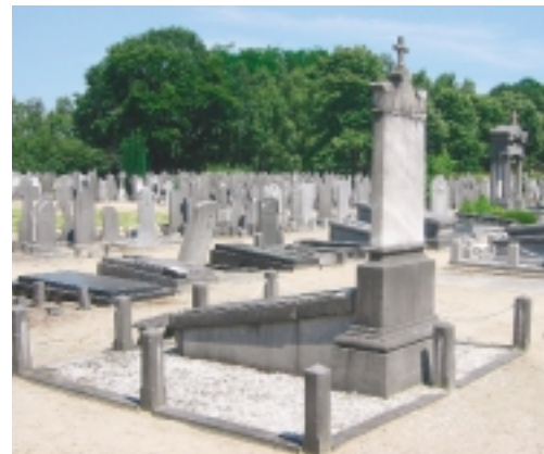
Het oude gedeelte van de Rooms-katholieke Begraafplaats aan de Mastendreef in Bergen op Zoom laat zien hoe individuele grafmonumenten als het ware samensmelten tot een monumentaal geheel